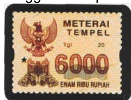
Nominal Rp. 6.000,-

Meterai Tempel desain tahun 2002 (lama) masih dapat dipergunakan sampai dengan tanggal 30 September 2005