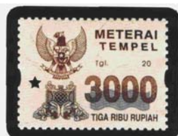
Nominal Rp. 3.000,-

Jakarta, 23 Maret 2005 Direktur Jenderal,